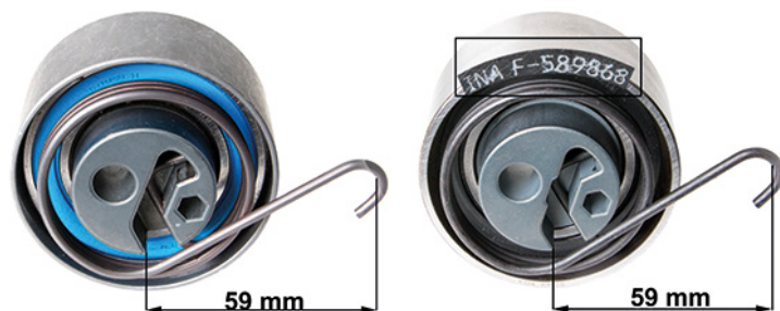
Slika 2: 531 0819 10 – stara izvedba (lijevo), nova izvedba (desno)

U cilju lakšeg uočavanja razlika između dijelova, promijenjene su izvedbe natezne remenice 531 0535 20 i natezne remenice 531 0819 10. Kataloški brojevi dijelova nisu se mijenjali.