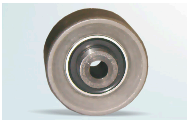
Figura 1: 532 0289 10 – Versiunea din metal