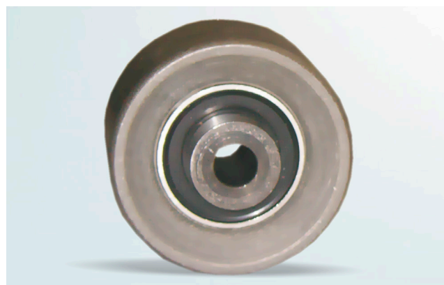
Снимка 1: 532 0289 10 – метална