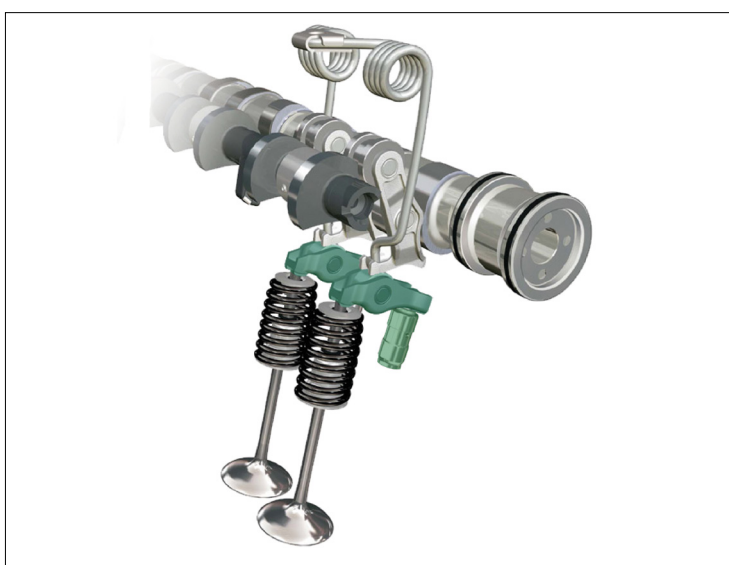
Slika 1: Pregled motora BMW Valvetronic

Kalibrirane klackalice postavljaju se i sa strane usisnog i ispušnog ventila kod motora BMW Valvetronic i PSA.