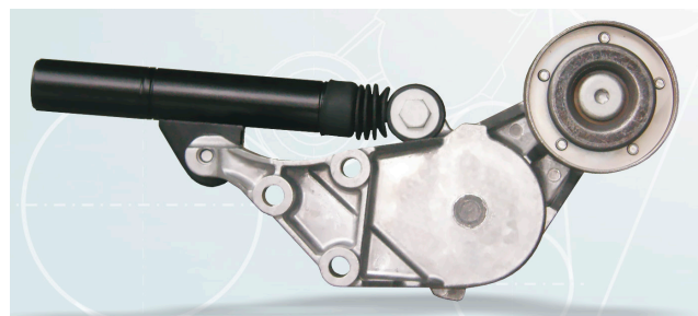
Obrázek 1: Napínací jednotka 533 0081 30 - použitá u motorů 1,9 TDI

*) SH -> napínací jednotka GFL -> alternátorová volnoběžka