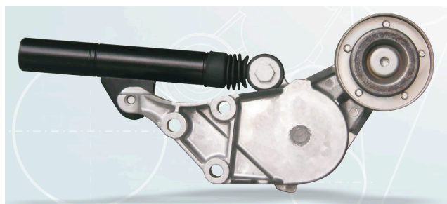
Фигура 1: Обтяжен елемент 5533 0081 30 – използван в 1.9 TDI двигателите

*) TU -> обтяжен елемент GFL -> ролка със свободен ход на алтернатора