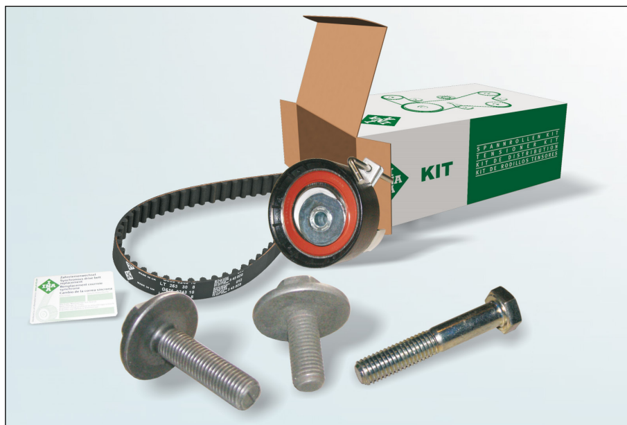
Slika 1: 530 0495 10 – komplet zobatega jermena INA vklj. s pritrditvenimi vijaki

Katal. št.: 530 0140 10 (KIT) 530 0495 10 (KIT)