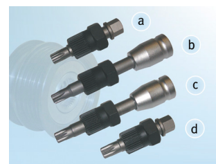
Зображення 2: Зображення спеціального інструменту