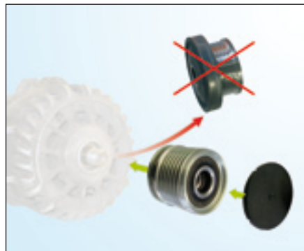
Fig. 3: Artikelvervanging