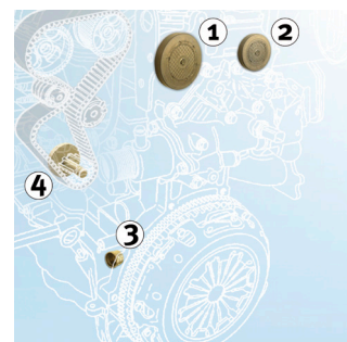
Εικόνα 2: Θέση τοποθέτησης

Κατά την εγκατάσταση των αναφερόμενων κιτ και σετ τεντωτήρα απαιτείται επίσης αλλαγή των εξαρτημάτων που αναφέρονται στην εικόνα 1. Ως επιπλέον υπηρεσία η INA διαθέτει αυτά τα εξαρτήματα σε μία συσκευασία.