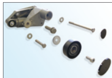
Fig. 3: Inhoud 533 0097 10

Een montage-instructie is bij de verpakking bijgevoegd.