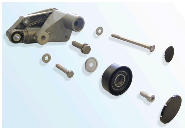
Billede 3: Leveringsomfang

Mekanisk strammeenhed 533 0015 10 blev erstattet med hydraulisk strammeenhed 533 0097 10.