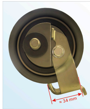
Εικόνα 1: 531 0399 20

Κωδικός OE: 531 0399 20 06B 109 243 (τρέχων) 531 0500 20 06B 109 243 (τρέχων) 06B 109 243 D 06B 109 243 A