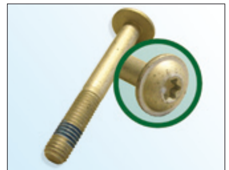
Fig. 3: LuK-AS-schroef

LuK-AS adviseert de originele bout (Fig. 2) te vervangen door de meegeleverde schroef.