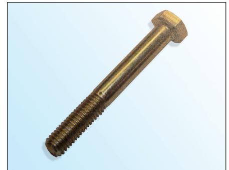
Fig. 2: Tornillo OE

En el marco del desarrollo continuo de nuestros productos y de la seguridad de la calidad INA suministra con la polea tensora 531 0342 30 un nuevo tornillo (fig. 3).