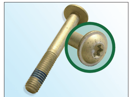
Fig. 3: Tornillo INA

INA recomienda cambiar el tornillo original (fig. 2) por el tornillo suministrado.