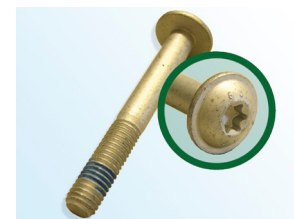
Рисунок 3: Schaeffler Automotive Aftermarket болт

В соответствии с непрерывным развитием нашей продукции и гарантии качества, Schaeffler Automotive Aftermarket в данный момент поставляет новый болт (рис.3) с натяжным роликом 531 0274 30.