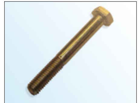
Fig. 2: OE-bout

In het kader van de voortdurende verdere ontwikkeling van onze producten en kwaliteitsborging levert LuK-AS bij de spanrol 531 0274 30 een nieuwe schroef (Fig. 3).