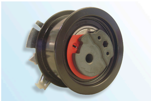
Зображення 1: 531 0628 30 (стара версія)

Ця технічна інформація показує візуальні характеристики «старої» і «нової» версії натяжного ролика.