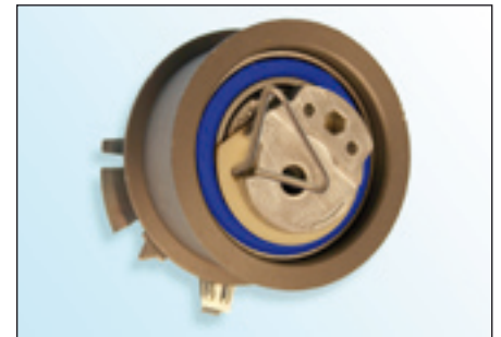
Fig. 2: 531 0628 30 (nieuwe uitvoering)