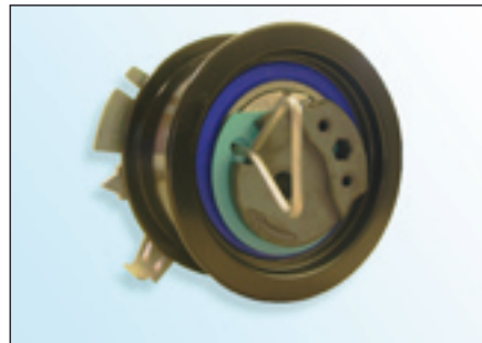
Fig. 1: 531 0628 30 (oude uitvoering)