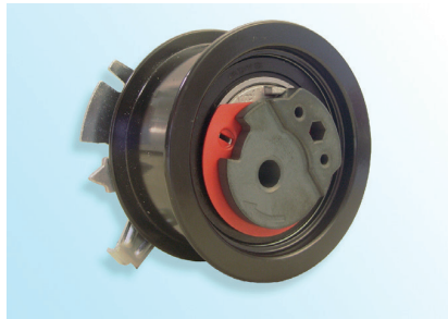
図1：531 0628 30 (旧バージョン)