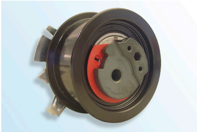
Εικόνα 1: 531 0628 30 (παλαιά παραλλαγή)

Αυτές οι πληροφορίες για το σέρβις δείχνουν τα οπτικά χαρακτηριστικά της „παλαιάς παραλλαγής“ και της „νέας παραλλαγής“.