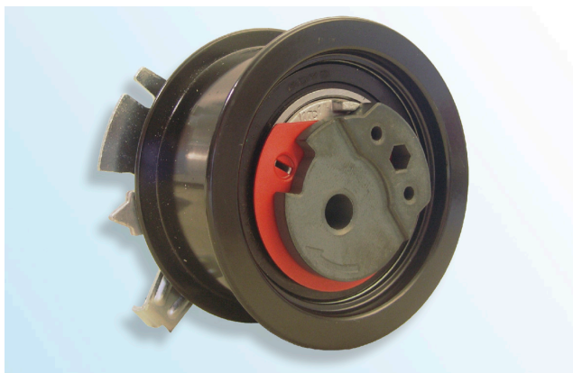
Снимка 1: 531 0628 30 (стария вариант)

Като част от непрестанното развитие на нашите продукти, обтяжната ролка 531 0628 30 бе модифицирана. Тази Сервизна информация показва визуалните характеристики на „стария вариант“ и на „новия вариант“.