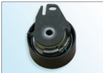
Fig. 1: OE-type

Beide spanroltypen zijn door de autofabrikant goedgekeurd.