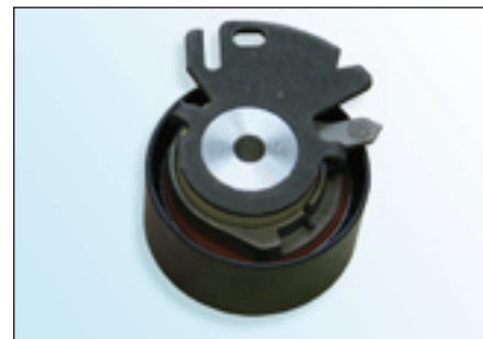
Fig. 2: OES-type

Deze spanrol wordt ook door LuK-AS op de reserveonderdelenmarkt geleverd.