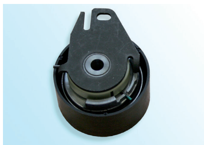
図 1 : OE タイプ

OE-No. : 7173 4799 4641 6489 (交換前) 4679 2898 (交換前)