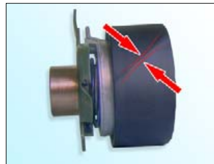
Slika 2: 531 0564 30 (bočni pogled)

Zatezni kotur 531 0564 30 (Sinus-Pulley) je u pogledu buke optimalizovani zatezni kotur, koji je bio specijalno razvijen za gore navedenu primenu.