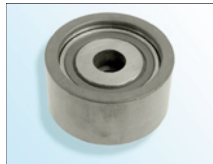
Fig. 2: 532 0189 10 (nieuwe uitvoering)

De geleiderol 532 0158 10 moet worden gemonteerd met behulp van een inbus-schroef met een schroefdraadlengte van 40 mm .