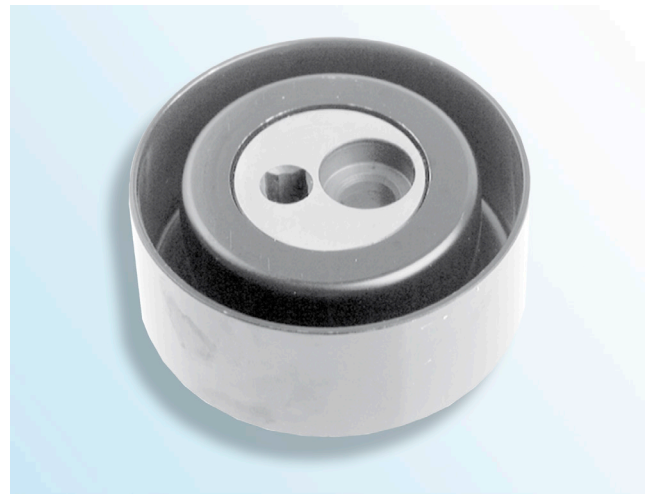
Зображення 1: Поверхня кочення ролика з металу