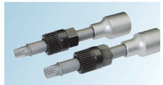
Art. Nr. 400 0201 10 Torx Art. Nr. 400 0200 10 Vielzahn