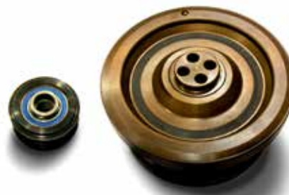
KIT PULEGGIA NEW DAMPER + PULEGGIA ALTERNATORE + ISTRUZIONI

I KIT Si è scelto di includere nello studio del processo anche l'alternatore, come componente del sistema di azionamento secondario con un maggiore momento di inerzia. Per liberare il sistema ausiliario dalle irregolarità di rotazione dell'albero motore, si è sviluppata per ogni applicazione di puleggia albero motore che lo necessita, la relativa puleggia libera alternatore che va a comporre un kit di trasmissione di potenza di rotazione del sistema ausiliario e al tempo stesso, garantisce l'assenza di rumore e vibrazioni. I kit sono forniti con indicazioni di applicazione che indicano le istruzioni di montaggio o che riportano in dettaglio i modelli su cui sono applicati.