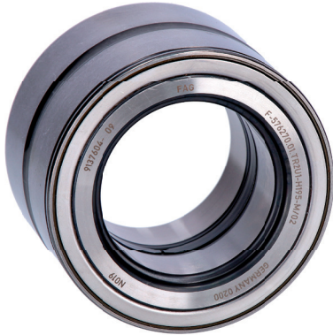
Option A | Variante A | Version A | Variante A | Variante A | Wariant A

Wheel Bearing | Radlager | Roulement de roue | Cojinete de rueda | Cuscinetto ruota | łożysko koła