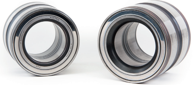
Şekil 1: Rulman iç bileziğinde sızdırmazlık elemanlı (sol) ve kenarı pahlı (sağ) Ağır Vasıta Porya Ünitesi

Parça No.: 201050 571762.01.H195 803194.26.H195 805003A.H195 805003CA.H195 805011.03.H195 805012.06.H195 805092.07.H195