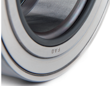
Şekil 2: O-halkalı Ağır Vasıta Porya Ünitesi

Temel fark, rulmanın iç bileziğinde görülebilir. Bazı rulman ünitelerinin iç yüzünde bir O-ring halkası (Şek. 2) bulunurken, diğer rulmanların pahlı veya yuvarlatılmış bir kenarı vardır (Şek. 3). Aşağıdaki tablo, rulman ünitelerinin özelliklerini ve montaj yönünü listeler