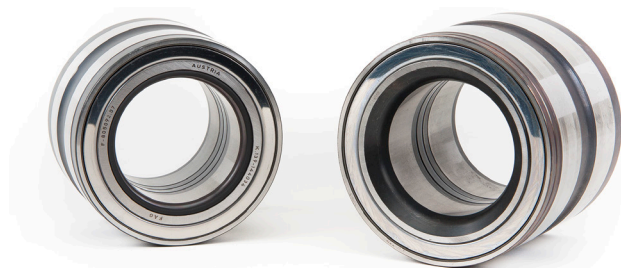
1. ábra: Truck Hub Unit tömítőgyűrűvel (balra) ill. leélezés csökkentése (jobbra) a csapágy külső gyűrűjén

Cikksz.: 805003CA.H195 805011C / 805011.03.H195 805012.06.H195 805092.07 / 805092.07.H195 571762.01.H195 803194.26 / 803194.26.H195 805003A.H195