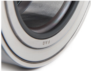
Fig 2: Truck Hub Unit con junta tórica

Para los rodamientos mencionados anteriormente se debe seguir la dirección de montaje. Esta se determina por la forma del canto plano del eje y del anillo interior del rodamiento de la THU, pero debe aclararse en esta información de servicio para su mejor comprensión.