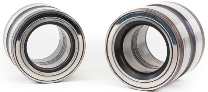
Fig 1: Truck Hub Unit con anillo de obturación (izda.) o reducción de los cantos (dcha.) en el anillo interior del rodamiento

La diferencia definitiva se observa en el anillo interior del rodamiento. En la parte interior de algunos rodamientos se encuentra una junta tórica (Fig. 2), mientras que en los demás rodamientos se observa en ese punto la denominada reducción/curvatura de los cantos (Fig. 3). En la siguiente tabla se muestra la característica y la dirección de montaje de los rodamientos.