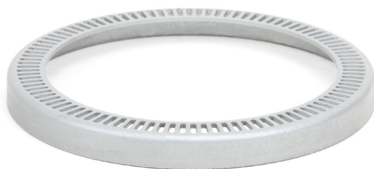
Senzorni obroč zavornega sistema ABS s kat. št. 434 0498 10

Ker je zgoraj navedene vstavitvene enote za popravilo (RIU) mogoče namestiti tudi v vozila, ki niso opremljena z zavornim sistemom ABS, podjetje Schaeffler Automotive Aftermarket v pakiranje ne priloži senzornega obroča zavornega sistema ABS.