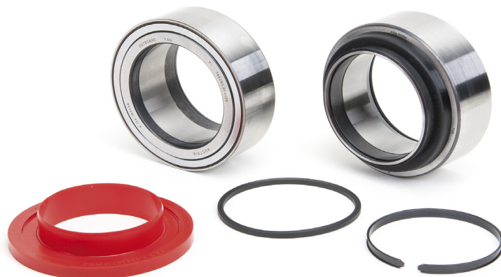
Рисунок 2: Новая версия (566283.01.H195)

Во время монтажа ремонтного ступичного модуля (RIU) с артикульным номером 566283.H195 на некоторых ступицах, возможно искривление пылезащитного колпака.