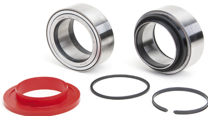
2. attēls: Jaunā versija (566283.01.H195)

Šīs tehniskās modifikācijas rezultātā, rezerves daļas numurs 566283.H195 ir aizvietots ar 566283.01.H195.