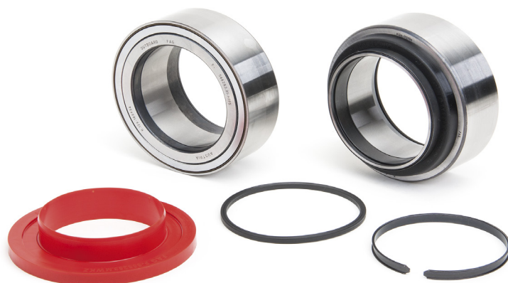
2 pav. Nauja versija (566283.01.H195)

Montuojant remontinį guolių komplektą (RIU) dalies numeris 566283.H195) apsauga nuo dulkių ant kai kurių ratų stebulių gali susisukti. Blogiausiu atveju susisukusi apsauga nuo dulkių gali remtis į guolį ir apsunkinti rato stebulės sukimąsi arba neleisti jai išvis sukis.