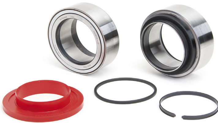
איור 2: גירסא חדשה (566283.01.H195)

חלק מחליף – ל RIU (יחידת ההכנסה לצורך תיקון): 566283.H195 הוחלף עם 566283.01.H195