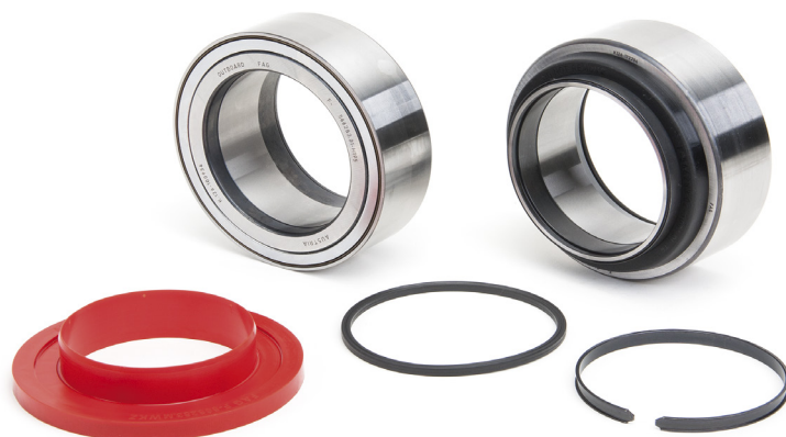
Снимка 2: Новия вариант (566283.01.H195)

Като резултат на тази техническа модификация, референтен номер 566283.H195 бе заменен с 566283.01.H195.