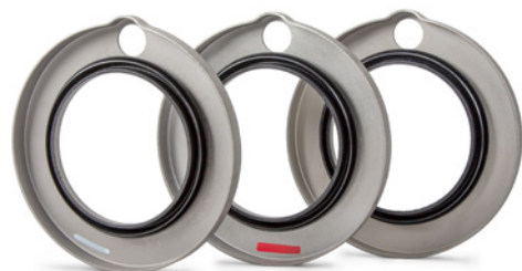
Image 3 : Les caches-poussière ont des diamètres intérieurs différents.

Respecter les préconisations du constructeur du véhicule!