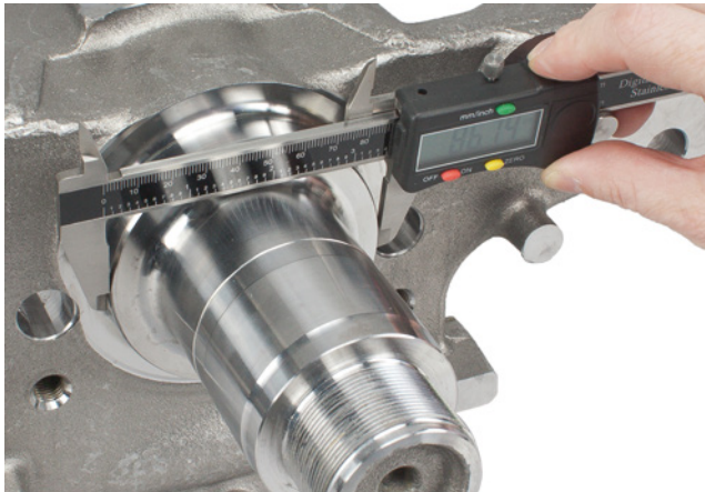
Image 2 : Pour déterminer lequel des trois caches-poussière est adapté, le diamètre du joint d'étanchéité doit être mesuré

Lors de l'identification, il faut tenir compte du fait qu'il existe 3 variantes différentes. Afin d'identifier le cache-poussière adapté, le diamètre du joint d'étanchéité doit être mesuré.