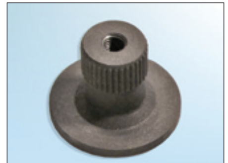
Fig. 2: Adapter 30648510

Draai de bevestigingsbouten aan met het door de autofabrikant voorgeschreven aanhaalmoment!