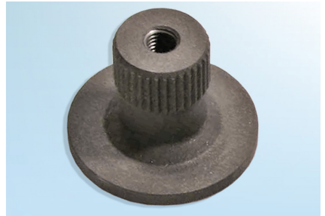
Kuva 2: Adapteri 30648510

Kiristä kiinnitysruuvit ajoneuvon valmistajan ohjeiden mukaisella kiristysmomentilla!