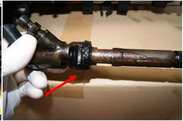
Befecskendezőfej tömítetlenség–új tömítés