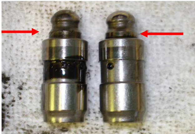
Hidrotőke végállásban , a szelepek már nem tömítenek- hidrotőke csere