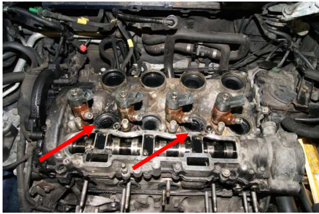
Tömítetlenség a kipufogócsonknál –új tömítés szükséges