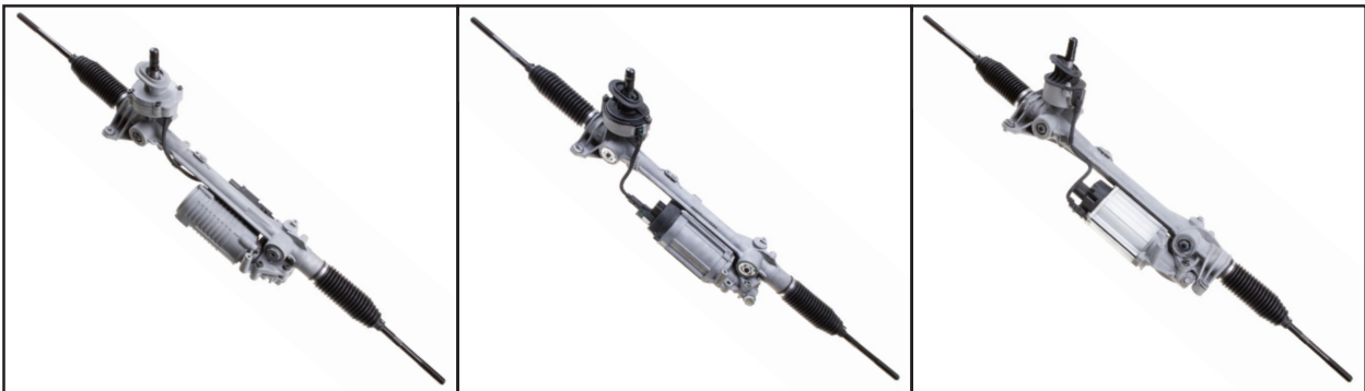
Fig. 1: Generazione I

Le seguenti figure possono essere utilizzate per identificare le diverse generazioni della scatola di comando dello sterzo.