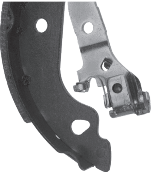
OE - ontwerp