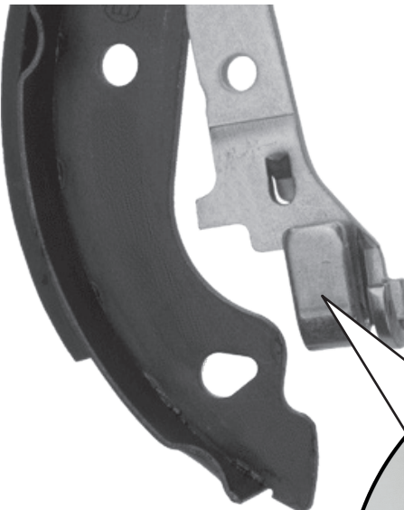
TRW - ontwerp