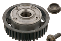
SWAG 60 93 6415