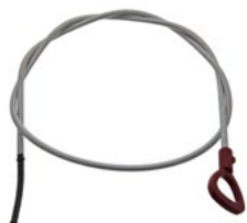
SWAG 10 93 8023