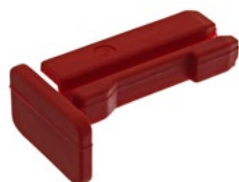
SWAG 10 94 4204

Nakon promene ulja ili ukoliko postoji sumnja da ulje curi, trebalo bi proveriti nivo ulja u automatskom menjaču. Šipka za merenje nivoa ulja u menjaču se ne ugrađuje fabrički.