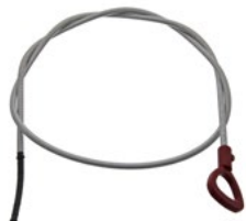
SWAG 10 93 8023

Искате да проверите нивото на маслото в 5 степенната автоматична скоростна кутия (722.6) на Mercedes-Benz? Няма проблем!