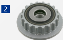
SWAG 32 92 6958