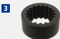
SWAG 32 93 0798

Para mais informação, visite: partsfinder.bilsteingroup.com