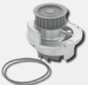
SWAG no. 40 15 0029 1.8i motorlar için