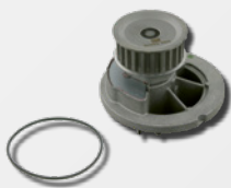
SWAG no. 40 92 4314 1.4i ve 1.6i 16 valf motorlar için