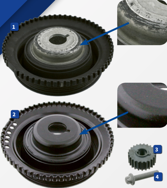
Opel 5614 430 plan

For more technical information please visit: partsfinder.bilsteingroup.com